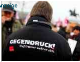
Dienst - Warnstreiks