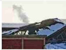
Schnee - Schnee: Einstürzende Dächer,...