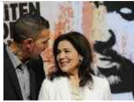
Film-Crew - Premiere